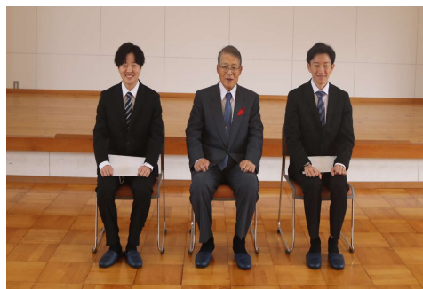
↑ 理事長と内定者2名で記念撮影をしました。