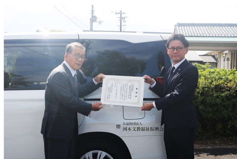
↑ ぞうていしき ようす かわもとぶんきょうふくしんこうかいさま かんしゃじょう 贈呈式の様子：河本文教福祉振興会様に感謝状を